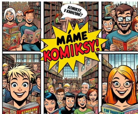
KNIHOVNA komiksy, manga i audioknihy pro každého