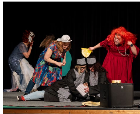
TOPAS z pohádky do pohádky a se spoustou zábavy