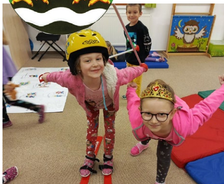
ŠKOLA od olympionády k masopustu