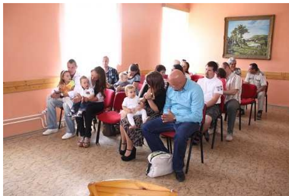
Fotografie pořízené na vítání občánků budou umístěné na webových stránkách obce.

Vážení sportovci a fanoušci kulatého nesmyslu, v sobotu 21.června se na místním víceúčelovém hřišti konalo první klání místních i přespolních borců v nohejbalu. Nečekané velký zájem příjemně překvapil. Osm tříčlenných družstev čekal málokdo. Medaile i trofeje byly rozdány do Tachlovic a Zbuzan a podle ohlasů zúčastněných nebude tento turnaj rozhodně poslední. Zájemci, hlase se již nyní na e-mail. Pevně věříme, že nezůstane jen u této ryze mužské disciplíny. Na základě předchozí výzvy se ozvalo několik zájemkyň, které by přivítali možnost si společně pinknout volejbal. O turnaji je jistě předčasné mluvit, ale bylo by prima využít teplých letních podvečerů a společně si zahrát. Apelujeme proto na milovníky tohoto prima sportu ( ženy i muže ), aby o sobě dali vědět. Napište na e-mail: topas@post.cz a my se pokusíme dát dohromady partu lidí, kteří by se už následně domluvili, podle svých možností. Ozvěte se brzy, ať si můžeme společně zahrát. váš TOPAS